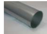
Rør i længder på 1 m eller 2 m