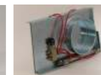
Lukkespjæld manuel eller automatisk