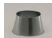
Reduktioner til ændring af diameter på rør