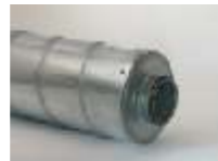
Lyddæmper med og uden indbygget lydbaffle