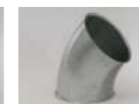
Bøjninger i 15° - 30° 45° - 90° alle med r = 1,5