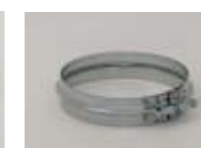
Spændebånd til samling af rør komponenter.