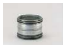
Muffer og nipler til samling af rør komponenter.