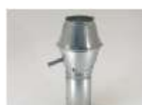
Luftindtag og afkast.