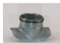
Saddelstykker og påstik