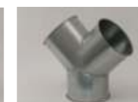
Grenrør og bukserør