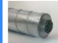
Lyddæmper med og uden indbygget lydbaffle