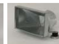
Gulvsug og fræserskærme m.m.