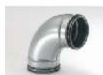
Bøjninger i 15° - 30° 45° - 90° alle med r = 1