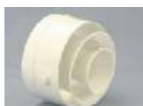
Indblæsning og udsugnings-Dysse/armatur