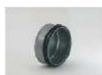
Indløb og endebund