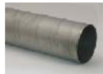
Rør i længder på 3 m eller 6 m

Sortimentet indeholder et utal af komponent typer, der muliggør selv den vanskeligste montage. Nedenfor ses et lille udpluk af vore komponenter.